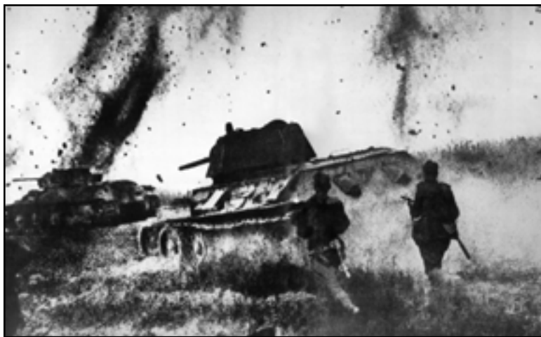
Танки идут вперед.